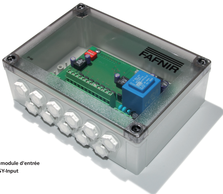
Le module d'entrée VISY-Input

Module d'entrée pour les alarmes externes