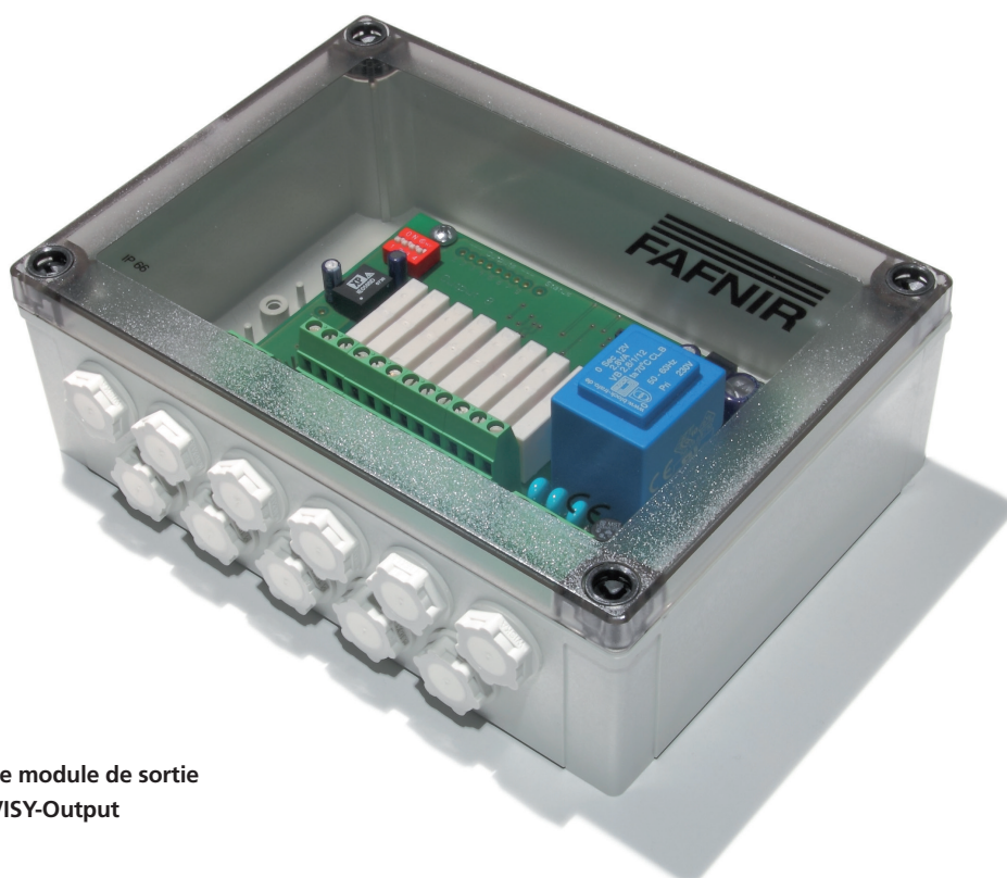
Le module de sortie VISY-Output