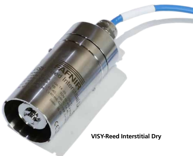
VISY-Reed Interstitial Dry

Los sensores VISY-Reed Interstitial posibilitan la detección de líquidos en la cámara intermedia de tanques con pared doble. Sirven como generadores de alarma y monitorean el nivel de líquido.