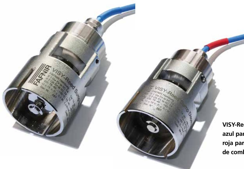
VISY-Reed Sump: azul para la cámara de inspección, roja para el sumidero del surtidor de combustible

Los sensores VISY-Reed son una solución económica para la detección sencilla y fiable de líquidos.